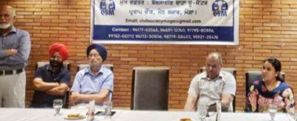
ਦੌਰਾਨ ਉਨ੍ਹਾਂ ਨੇ 70 ਦੇ ਕਰੀਬ ਨਸ਼ੇ ਦੇ ਵੱਡੇ ਸੁਦਾਗਰਾਂ ਖਿਲਾਫ ਕੇਸ ਦਰਜ ਕੀਤੇ ਸਨ, ਜਿਨ੍ਹਾਂ ਵਿੱਚੋਂ 25 ਨੂੰ ਸਜ਼ਾ ਹੋ ਚੁੱਕੀ ਹੈ ਤੇ 45 ਕੇਸਾਂ ਦੀ ਪਰਵਾਈ ਹਾਲੇ ਵੀ ਉਹ ਆਪਣੇ ਖਰਚੇ ਤੇ ਕਰ ਰਹੇ ਹਨ।

ਜਿਲਿਆਂ ਦੇ ਸਮਾਜ ਸੇਵੀਆਂ ਨਾਲ ਮੀਟਿੰਗ ਕਰਕੇ ਵਿਚਾਰ ਚਰਚਾ ਕਰਨ ਉਪਰੰਤ ਸੰਬੰਧ ਦੌਰਾਨ ਕੀਤਾ। ਉਨ੍ਹਾਂ ਦੱਸਿਆ ਕਿ ਆਪਣੀ ਸਰਵਿਸ