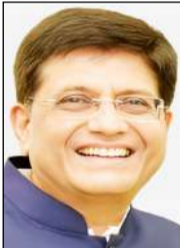
ਪੀਯੂਸ਼ ਗੋਇਲ (ਲੇਖਕ ਕੇਂਦਰੀ ਵਣਜ ਅਤੇ ਉਦਯੋਗ ਮੰਤਰੀ ਹਨ)

ਨੂੰ ਨਿਵੇਸ਼ ਅਤੇ ਕਾਰੋਬਾਰ ਲਈ ਵਧੇਰੇ ਭਰੋਸੇਯੋਗ ਅਤੇ ਅਨੁਮਾਨ ਲਗਾਉਣ ਯੋਗ ਮੰਜ਼ਿਲ ਬਣਾ ਕੇ ਇਸ ਰਫਤਾਰ ਨੂੰ ਹੋਰ ਤੇਜ਼ ਕਰਨਾ ਹੈ। ਇਸ ਸੁਧਾਰ ਨਾਲ ਨਿਆਂ ਪ੍ਰਣਾਲੀ ਨੂੰ ਵੀ ਰਾਹਤ ਮਿਲੇਗੀ। 5.5 ਕਰੋੜ ਤੋਂ ਵੱਧ ਪੇਂਡਿੰਗ ਮਾਮਲਿਆਂ—ਜਿਨ੍ਹਾਂ ਵਿੱਚ ਜ਼ਿਲ੍ਹਾ ਅਤੇ ਹੇਠਲੀਆਂ ਬਦਾਲਿਆਂ ਦੇ ਲਗਭਗ 40 ਕਰੋੜ ਮਾਮਲੇ ਸ਼ਾਮਲ ਹਨ— ਵਿੱਚੋਂ ਕਈ ਛੋਟੇ-ਮੋਟੇ ਨਿਯਮਾਂ ਦੀ ਉਲੰਘਣਾ ਨਾਲ ਜੁੜੇ ਹੋਏ ਹਨ, ਜਿਨ੍ਹਾਂ ਨੂੰ ਹੁਣ ਅਪਰਾਧ ਦੀ ਸ਼੍ਰੇਣੀ ਤੋਂ ਬਾਹਰ ਕਰ ਦਿੱਤਾ ਗਿਆ ਹੈ। ਅਜਿਹੇ ਮਾਮਲਿਆਂ ਨੂੰ ਪ੍ਰਸ਼ਾਸਨਿਕ ਫੈਸਲੇ ਲਈ ਭੇਜਣਾ ਸਿਰਫ ਇੱਕ ਕਾਰੋਬਾਰੀ ਸੁਧਾਰ ਨਹੀਂ ਹੈ, ਸਗੋਂ ਇੱਕ ਨਿਆਇਕ ਸੁਧਾਰ ਵੀ ਹੈ; ਇਸ ਨਾਲ ਅਦਾਲਤਾਂ ਨੂੰ ਆਪਣੇ ਸੀਮਤ ਸਮੇਂ ਅਤੇ ਸੰਸਾਰਾਂ ਨੂੰ ਗੰਭੀਰ ਵਿਵਾਦਾਂ ਅਤੇ ਨਿਆਂ ਨਾਲ ਜੁੜੇ ਅਹਿਮ ਸਵਾਲਾਂ 'ਤੇ ਕੇਂਦਰਿਤ ਕਰਨ ਦਾ ਕੰਮ ਮਿਲਦਾ ਹੈ। ਗੰਭੀਰ ਉਲੰਘਣਾਵਾਂ ਲਈ ਸਖ਼ਤ ਕਾਰਵਾਈ ਜਾਰੀ ਰਹੇਗੀ। ਸਿੱਧੇ ਸਖ਼ਤੀ ਜ਼ਰੂਰੀ ਹੈ, ਉੱਥੇ ਕਾਨੂੰਨ ਪੂਰੀ ਤਰ੍ਹਾਂ ਸਖ਼ਤ ਬਣਿਆ ਰਹੇਗਾ। ਬਦਾਲਿਆਂ ਸਿਰਫ ਵਿਸ਼ੇਸ਼ਤਾਵਾਂ ਵਿੱਚ ਆਇਆ ਹੈ। ਸ਼ਾਸਨ ਹੁਣ ਸ਼ੱਕ ਤੋਂ ਭਰੋਸੇ, ਮੁਕੱਦਮੇ ਤੋਂ ਸੁਧਾਰ ਅਤੇ ਡਰ ਤੋਂ ਆਜ਼ਾਦੀ ਵੱਲ ਵਧ ਰਿਹਾ ਹੈ।