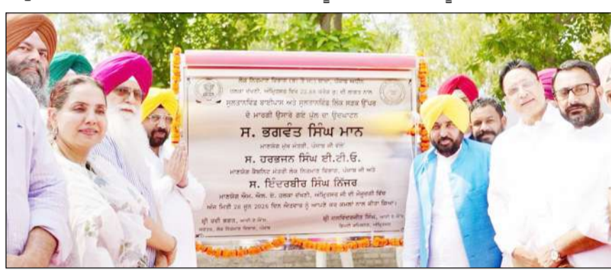
ਅਤੇ ਹੋਰ ਵਾਹਟ ਹਾਰਵੈਸਟਿੰਗ ਦੀ ਵੀ ਵਿਵਸਥਾ ਕੀਤੀ ਗਈ ਹੈ। ਭਗਵੰਤ ਸੜਕਾਂ, ਖੇਡ ਮੈਦਾਨਾਂ, ਜਿਮਾਂ, ਸੁਰੱਖਾ ਕਲੀਨਿਕਾਂ ਅਤੇ ਹੋਰ ਬੁਨਿਆਦੀ

ਸਿਰਫ ਬਦਨਾਮ ਕਰਨ ਦੀ ਰਾਜਨੀਤੀ ਕਰ ਰਹੀ ਹੈ। ਉਨ੍ਹਾਂ ਦੱਸਿਆ ਕਿ ਲੋਕ ਸਰਕਾਰ ਦੇ ਕੰਮਾਂ ਤੋਂ ਸੰਤੁਸ਼ਟ ਹਨ ਅਤੇ ਆਉਣ ਵਾਲੇ ਸਮੇਂ ਵਿੱਚ ਵੀ ਵਿਕਾਸ ਦੇ ਆਧਾਰ 'ਤੇ ਹੀ ਆਪਣਾ ਫੈਸਲਾ ਦੇਣਗੇ। ਮੁੱਖ ਮੰਤਰੀ ਨੇ ਕਿਹਾ ਕਿ ਸੂਬੇ ਵਿੱਚ ਸੰਭਾਵਿਤ ਹੜ੍ਹਾਂ ਨਾਲ ਨਜਿੱਠਣ ਲਈ ਵੀ ਸਰਕਾਰ ਨੇ ਪਹਿਲਾਂ ਹੀ ਪੂਰੇ ਪ੍ਰਬੰਧ ਕਰ ਲਏ ਹਨ। ਕਮਜ਼ੋਰ ਬੰਨ੍ਹਾਂ ਨੂੰ ਮਜ਼ਬੂਤ ਕੀਤਾ ਗਿਆ ਹੈ, ਡਰੇਨਾਂ ਅਤੇ ਰਜਵਾਹਿਆਂ ਦੀ ਸਫਾਈ ਕੀਤੀ ਗਈ ਹੈ ਅਤੇ ਪਾਣੀ ਦੇ ਪ੍ਰਬੰਧ 'ਤੇ ਲਗਾਤਾਰ ਨਿਗਰਾਨੀ ਰੱਖੀ ਜਾ ਰਹੀ ਹੈ। ਉਨ੍ਹਾਂ ਭਰੋਸਾ ਦਿੱਤਾ ਕਿ ਪੰਜਾਬ ਵਿੱਚ ਨਾ ਤਾਂ ਪਾਣੀ ਦੀ ਕੋਈ ਕਮੀ ਆਉਣ ਦਿੱਤੀ ਜਾਵੇਗੀ ਅਤੇ ਨਾ ਹੀ ਵਿਕਾਸ ਕਾਰਜਾਂ ਦੀ ਰਫਤਾਰ ਰੁਕਣ ਦਿੱਤੀ ਜਾਵੇਗੀ।