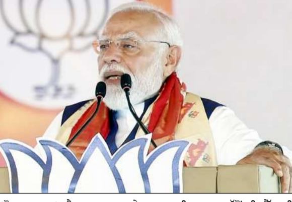
(ਸੋਲਰ ਪਾਵਰ) ਪੈਦਾ ਕਰਨ ਵਾਲੇ ਦੁਨੀਆ ਦੇ ਮੋਹਰੀ ਦੇਸ਼ਾਂ ਵਿੱਚ ਸ਼ਾਮਲ ਹੋ ਗਿਆ ਹੈ। ਉਨ੍ਹਾਂ ਦੱਸਿਆ ਕਿ ਪਹਿਲਾਂ ਸਰਕਾਰ ਦਾ ਮੁੱਖ ਟੀਚਾ ਹਰ ਘਰ ਤੱਕ ਔਲ ਪੀ ਜੀ ਸਿਲੰਡਰ ਪਹੁੰਚਾਉਣਾ ਸੀ, ਪਰ ਹੁਣ ਧਿਆਨ ਸਸਤੀ ਪਾਈਪ ਵਾਲੀ ਗੈਸ ਦੀ ਸਪਲਾਈ ਵਧਾਉਣ ਵੱਲ ਹੈ। ਇਸ ਦੇ

ਚੇਨਈ/ਬਿਊਰੋ ਪ੍ਰਧਾਨ ਮੰਤਰੀ ਨਰਿੰਦਰ ਮੋਦੀ ਨੇ ਐਤਵਾਰ ਨੂੰ ਕਿਹਾ ਕਿ ਪੱਛਮੀ ਏਸ਼ੀਆ ਦੇ ਸੰਕਟ ਦੇ ਮੱਦੇਨਜ਼ਰ ਪੈਟਰੋਲ, ਡੀਜ਼ਲ ਅਤੇ ਗੈਸ ਦੀ ਸੰਜਮ ਨਾਲ ਵਰਤੋਂ ਕਰਨਾ ਸਮੇਂ ਦੀ ਲੋੜ ਹੈ। ਤੇਲਗਾਨਾ ਵਿੱਚ 9,400 ਕਰੋੜ ਰੁਪਏ ਦੇ ਵਿਕਾਸ ਕਾਰਜਾਂ ਦਾ ਨੀਂਹ ਪੱਥਰ ਰੱਖਣ ਅਤੇ ਉਦਯਾਨ ਕਰਨ ਦੌਰਾਨ ਪ੍ਰਧਾਨ ਮੰਤਰੀ ਮੋਦੀ ਨੇ ਕਿਹਾ ਕਿ ਸਾਨੂੰ ਦਰਅਸਲ ਕੀਤੇ ਜਾਣ ਵਾਲੇ ਪੈਟਰੋਲ ਉਤਪਾਦਾਂ ਦੀ ਵਰਤੋਂ ਸਿਰਫ਼ ਲੋੜ ਪੈਣ 'ਤੇ ਹੀ ਕਰਨੀ ਚਾਹੀਦੀ ਹੈ, ਕਿਉਂਕਿ ਇਸ ਨਾਲ ਨਾ ਸਿਰਫ਼ ਵਿਦੇਸ਼ੀ ਮੁਦਰਾ ਦੀ ਬਚਤ ਹੋਵੇਗੀ ਸਗੋਂ ਜੰਗ ਦੇ ਮਾੜੇ ਪ੍ਰਭਾਵ ਵੀ ਘੱਟ ਹੋਣਗੇ। ਪ੍ਰਧਾਨ ਮੰਤਰੀ ਨੇ ਕਿਹਾ ਕਿ ਪਿਛਲੇ ਕੁਝ ਸਾਲਾਂ ਦੌਰਾਨ ਭਾਰਤ ਸੂਰਜੀ ਊਰਜਾ