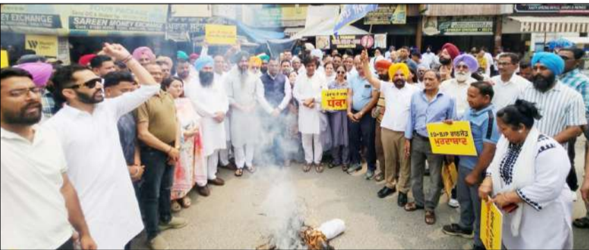
ਦਫ਼ਤਰਾਂ ਦਾ ਘਿਰਾਓ ਕੀਤਾ ਅਤੇ ਨਰਿੰਦਰ ਮੋਦੀ ਤੇ ਭਾਜਪਾ ਸਰਕਾਰ ਖਿਲਾਫ਼ ਜ਼ੋਰਦਾਰ ਨਾਅਰੇਬਾਜ਼ੀ ਕੀਤੀ। ਇਹ ਪ੍ਰਦਰਸ਼ਨ ਹੁਸ਼ਿਆਰਪੁਰ, ਪਟਿਆਲਾ, ਮੋਹਾਲੀ ਅਤੇ ਪੰਜਾਬ ਦੇ ਹੋਰ ਹਿੱਸਿਆਂ ਵਿੱਚ ਕੀਤੇ ਗਏ, ਜਿੱਥੇ ‘ਆਪ’ ਆਗੂਆਂ ਨੇ ਕਿਹਾ ਕਿ ਭਾਜਪਾ ਚੁਣੀਆਂ ਹੋਈਆਂ ਸਰਕਾਰਾਂ ਨੂੰ ਡਰਾਉਣ ਅਤੇ ਵਿਰੋਧੀ ਧਿਰ ਦੀ ਆਵਾਜ਼ ਨੂੰ ਚੁੱਪ ਕਰਾਉਣ ਲਈ ਜਾਂਚ ਏਜੰਸੀਆਂ ਨੂੰ ਸਿਆਸੀ ਹਥਿਆਰ ਵਜੋਂ ਵਰਤ ਰਹੀ ਹੈ। ਪ੍ਰਦਰਸ਼ਨਕਾਰੀਆਂ ਨੇ ਹੱਥਾਂ ਵਿੱਚ ਤਖ਼ਤੀਆਂ ਫੜੀਆਂ ਹੋਈਆਂ ਸਨ, ਮੋਦੀ ਸਰਕਾਰ ਵਿਰੁੱਧ

ਚੰਡੀਗੜ੍ਹ/ਬਿਊਰੋ ਆਮ ਆਦਮੀ ਪਾਰਟੀ (ਆਪ) ਨੇ ਐਤਵਾਰ ਨੂੰ ਭਾਜਪਾ ਦੀ ਅਗਵਾਈ ਵਾਲੀ ਕੇਂਦਰ ਸਰਕਾਰ ਵਿਰੁੱਧ ਸੂਬਾ ਵਿਆਪੀ ਪ੍ਰਦਰਸ਼ਨ ਸ਼ੁਰੂ ਕਰਦਿਆਂ ਦਾਅਵਾ ਕੀਤਾ ਕਿ ਭਾਜਪਾ ਵਿਰੋਧੀ ਆਗੂਆਂ ਨੂੰ ਨਿਸ਼ਾਨਾ ਬਣਾਉਣ ਅਤੇ ਗੈਰ-ਭਾਜਪਾ ਸਰਕਾਰਾਂ ਨੂੰ ਅਸਥਿਰ ਕਰਨ ਲਈ ਇਨਫੋਰਸਮੈਂਟ ਡਾਇਰੈਕਟੋਰੇਟ ਈਡੀ, ਸੀਬੀਐਚੀ ਅਤੇ ਇਨਕਮ ਟੈਕਸ ਵਿਭਾਗ ਵਰਗੀਆਂ ਕੇਂਦਰੀ ਏਜੰਸੀਆਂ ਦੀ ਦੁਰਵਰਤੋਂ ਕਰ ਰਹੀ ਹੈ। ਕੈਬਨਿਟ ਮੰਤਰੀ ਸੰਜੀਵ ਅਰੋੜਾ ਵਿਰੁੱਧ ਈਡੀ ਦੀ ਕਾਰਵਾਈ ਨੂੰ ਲੈ ਕੇ ‘ਆਪ’ ਆਗੂਆਂ ਅਤੇ ਵਰਕਰਾਂ ਨੇ ਪੰਜਾਬ ਵਿੱਚ ‘ਰੈਡ ਕ੍ਰਾਊਟਰ’ ਤੋਂ ਭਾਜਪਾ