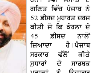
ਹਨ। 9ਵੀਂ ਜਮਾਤ ਦੇ ਗਣਿਤ ਵਿੱਚ ਪੰਜਾਬ ਨੇ 52 ਫ਼ੀਸਦ ਮੁਹਾਰਤ ਦਰਜ ਕੀਤੀ ਜੋ ਕਿ ਕੇਰਲਾ ਦੇ 45 ਫ਼ੀਸਦ ਨਾਲੋਂ ਜ਼ਿਆਦਾ ਹੈ। ਪੰਜਾਬ ਸਰਕਾਰ ਵੱਲੋਂ ਕੀਤੇ ਸੁਧਾਰਾਂ ਦੇ ਸਾਥਕ ਪ੍ਰਭਾਵਾਂ ਨੂੰ ਉਜਾਗਰ ਕਰਦਿਆਂ ਸਿੱਖਿਆ ਮੰਤਰੀ ਨੇ ਕਿਹਾ ਕਿ ਮੁੱਖ ਮੰਤਰੀ ਸ. ਭਗਵੰਤ ਸਿੰਘ ਮਾਨ ਦੀ ਅਗਵਾਈ ਹੇਠ ਪੰਜਾਬ ਸਰਕਾਰ ਨੇ ਪਿਛਲੇ ਸਮਰੱਥ ਅਤੇ ਸਕੂਲ ਆਫ਼ ਐਮੀਨੈਂਸ ਪ੍ਰੋਗਰਾਮ ਰਾਹੀਂ ਕੇਵਿਡ ਮਹਾਰਾਜੀ ਤੋਂ ਬਾਅਦ ਕੀਤੇ ਗਏ ਸੁਧਾਰਾਂ ਦੇ ਠੋਸ ਨਤੀਜੇ ਸਾਹਮਣੇ ਆਏ ਹਨ। ਨੀਤੀ ਆਯੋਗ ਦੀ ਰਿਪੋਰਟ ਦੇ ਨਤੀਜਿਆਂ ਦਾ ਹਵਾਲਾ ਦਿੰਦਿਆਂ ਉਨ੍ਹਾਂ ਅੱਗੇ ਕਿਹਾ, ‘ਸੂਬੇ ਦੇ 99.9 ਫ਼ੀਸਦ • ਬਕੀ ਸਫ਼ਾ 2 'ਤੇ

ਦਿਵਾਦੇ ਅਤੇ ਅਮਲ ਦਾ ਸੁਮੇਲ ਹੈ, ਜਿਸ ਨਾਲ ਬਿਹਤਰ ਨਤੀਜੇ ਸਾਹਮਣੇ ਆਏ ਹਨ। ਨੀਤੀ ਆਯੋਗ ਦੀ ਰਿਪੋਰਟ ਸਬੰਧੀ ਵੇਰਵੇ ਸਾਂਝੇ ਕਰਦਿਆਂ ਉਨ੍ਹਾਂ ਕਿਹਾ, ‘ਪੰਜਾਬ ਨੇ ਤੀਜੀ ਜਮਾਤ ਵਿੱਚ ਭਾਸ਼ਾ 'ਚ 82 ਫ਼ੀਸਦ ਅਤੇ ਗਣਿਤ ਵਿੱਚ 78 ਫ਼ੀਸਦ ਅੰਕ ਹਾਸਲ ਕੀਤੇ, ਜੋ ਕੇਰਲਾ ਦੇ ਕੁਮਵਾਰ 75 ਫ਼ੀਸਦ ਅਤੇ 70 ਫ਼ੀਸਦ ਤੋਂ ਵੱਧ