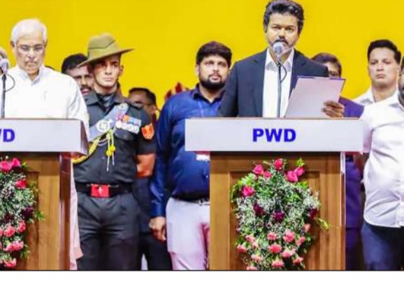
ਦੇ ਅੰਦਰ ਅਤੇ ਬਾਹਰ ਲੱਖਾਂ ਦੀ ਗਿਣਤੀ ਵਿੱਚ ਵਿਜੇ ਦੇ ਪ੍ਰਸ਼ੋਕ ਅਤੇ ਸਮਾਜਕ ਜਸ਼ਨ ਮਨਾ ਰਹੇ ਹਨ। ਵਿਜੇ ਨੂੰ ਹੁਣ 13 ਮਈ ਤੱਕ ਵਿਧਾਨ ਸਭਾ ਵਿੱਚ ਆਪਣਾ ਬਹੁਮਤ ਸਾਬਤ

ਸਾਲਾਂ ਵਿੱਚ ਇਹ ਪਹਿਲੀ ਵਾਰ ਹੈ ਜਦੋਂ ਡੀ. ਐਮ. ਕੇ ਜਾਂ ਏ. ਆਈ. ਏ. ਡੀ. ਐਮ. ਕੇ ਵਰਗੀਆਂ ਦਾ ਵਿਭਾਗ ਪਾਰਟੀਆਂ ਨੂੰ ਪਛਾਣ ਕੇ ਕਿਸੇ ਤੀਜੀ ਧਿਰ ਨੇ ਸੱਤਾ ਸੰਭਾਲੀ ਹੈ। ਸਟੇਡੀਅਮ