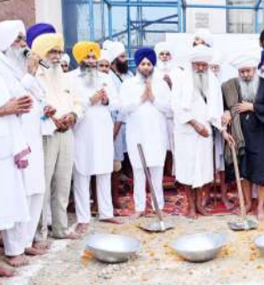
ਪੁੱਜਦੀਆਂ ਸੰਗਤਾਂ ਦੀ ਸਹੂਲਤ ਲਈ ਨਿਰੰਤਰ ਯਤਨਸ਼ੀਲ ਹੈ। ਸੰਗਤਾਂ ਦੀ ਸਹੂਲਤ ਨੂੰ ਮੁੱਖ ਰੱਖਦਿਆਂ ਅੰਤਿਮ ਕਮੇਟੀ ਨੇ ਇਸ ਰਸਤੇ ਦੇ ਨਵੀਕੀਰਨ ਅਤੇ ਸੁੰਦਰੀਕਰਨ ਨੂੰ ਪ੍ਰਵਾਨਗੀ ਦਿੱਤੀ ਸੀ, ਜਿਸ ਦੀ ਅੱਜ ਹਰਸਮੀ ਤੌਰ 'ਤੇ ਸ਼ੁਰੂਆਤ ਕੀਤੀ ਗਈ। ਉਨ੍ਹਾਂ ਕਿਹਾ ਕਿ ਇਸ ਰਸਤੇ ਨੂੰ

ਮਾਨਵਤਾ ਦੀ ਆਸ਼ਾ ਦਾ ਕੇਂਦਰ ਹੈ ਅਤੇ ਹਰ ਸਿੱਖ ਇਸ ਪਾਵਨ ਅਸਥਾਨ 'ਤੇ ਨਤਾਸਤਕ ਹੋਣ ਦੀ ਤਾਝ ਰੱਖਦਾ ਹੈ। ਉਨ੍ਹਾਂ ਕਿਹਾ ਕਿ ਸ਼੍ਰੋਮਣੀ ਕਮੇਟੀ ਸ੍ਰੀ ਦਰਬਾਰ ਸਾਹਿਬ ਵਿਖੇ ਦਰਸ਼ਨਾਂ ਲਈ