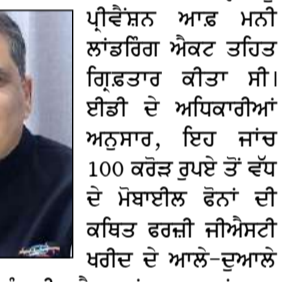
ਚੰਡੀਗੜ੍ਹ ਵਿੱਚ ਸੈਨਾ ਅਦਾਲਤ ਨੇ ਸੰਜੀਵ ਅਰੋੜਾ ਨੂੰ 100 ਕਰੋੜ ਰੁਪਏ ਦੇ ਕਬਿਤ ਜ਼ਮੀਨੀ ਧੋਖਾਧੜੀ ਨਾਲ ਲਾਭਦਾਇਕ ਵਿੱਚ ਸੱਤ ਦਿਨਾਂ ਲਈ ਐਨਫੋਰਸਮੈਂਟ ਡਾਇਰੈਕਟੋਰੇਟ ਦੀ ਹਿਰਾਸਤ ਵਿੱਚ ਭੇਜ ਦਿੱਤਾ ਹੈ। ਈਡੀ ਨੇ ਮੰਤਰੀ ਦੇ ਦਿੱਲੀ, ਗੁਰੂਗ੍ਰਾਮ ਅਤੇ

ਚੰਡੀਗੜ੍ਹ/ਬਿਊਰੋ ਗੁਰੂਗ੍ਰਾਮ ਵਿੱਚ ਸੈਨਾ ਅਦਾਲਤ ਨੇ ਸੰਜੀਵ ਅਰੋੜਾ ਦੇ ਕੈਬਨਿਟ ਮੰਤਰੀ ਅਤੇ ਆਮ ਆਦਮੀ ਪਾਰਟੀ (ਆਪ) ਦੇ ਆਗੂ ਸੰਜੀਵ ਅਰੋੜਾ ਨੂੰ 100 ਕਰੋੜ ਰੁਪਏ ਦੇ ਕਬਿਤ ਜ਼ਮੀਨੀ ਧੋਖਾਧੜੀ ਨਾਲ ਲਾਭਦਾਇਕ ਵਿੱਚ ਸੱਤ ਦਿਨਾਂ ਲਈ ਐਨਫੋਰਸਮੈਂਟ ਡਾਇਰੈਕਟੋਰੇਟ ਦੀ ਹਿਰਾਸਤ ਵਿੱਚ ਭੇਜ ਦਿੱਤਾ ਹੈ। ਈਡੀ ਨੇ ਮੰਤਰੀ ਦੇ ਦਿੱਲੀ, ਗੁਰੂਗ੍ਰਾਮ ਅਤੇ